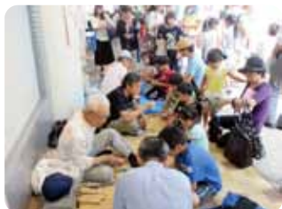
竹トンボコーナー