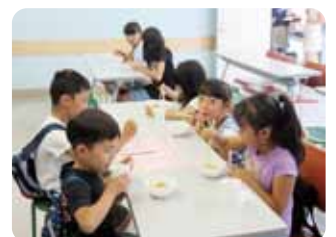
すいとんコーナー