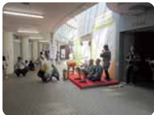
獅子舞のお囃子でお出迎え