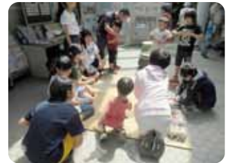
担当はベーゴマコーナー

いろいろな昔の遊びがありました。初めての経験?でも丁寧な説明で作法を覚えた真剣な面持ちのお茶席、やっぱり目当ては、すいとん汁だったかな。