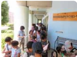
開場前の長蛇の列

午前9時30分の「まつり」開始時刻前には、すでに沢山の子供たちが首を長くして待っていました。