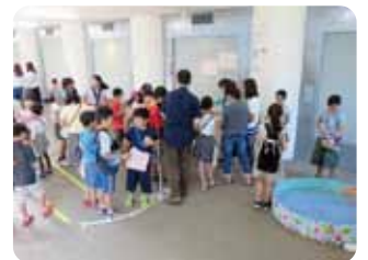
スーパーボールすくいコーナー

松井まちづくり協議会では、夏季交流懇談会、松井地区文化祭、松井ウォークラリー大会、松井地区新年祝賀会、松井地区成人のつどい及びこの三世代まつり、その他を通じて、大勢の地域の皆さんが参加して創り上げられる地域間、世代間の絆で結ばれた地域社会の拡大を目指していくため、これらの協働事業を積極的に実施・応援していくこととしています。