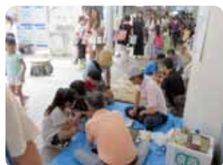
針金ゴマコーナー

なかなか廻すことができないベーゴマ、寄り目になりながらビーズに通して作っていたビーズストラップ、危なっかしい手つきでナイフを使って完成した竹トンボ、横綱同士の対戦の紙相撲、折り曲げが難しい針金ゴマ、なかなか裏返せないメンコ、その他