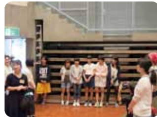
東中学校女子生徒のみなさん