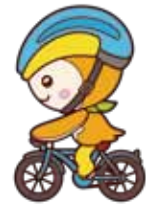
交通ルールを守ってね

また、地区内4つの小学校の新入学児童には毎年黄色いランドセルカバーを贈呈する事業も行っています。