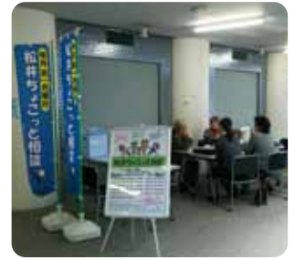
松井ちょこっと相談