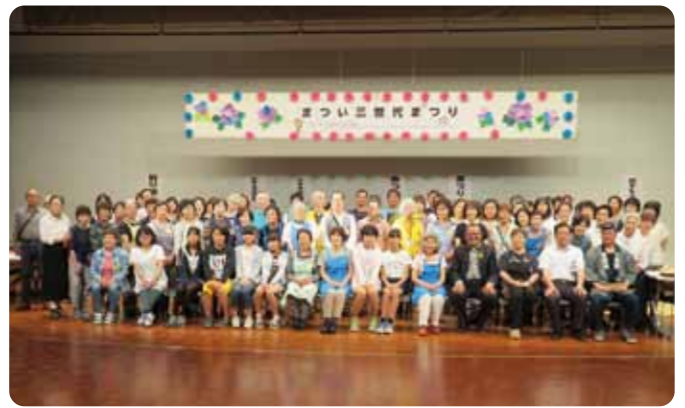
スタッフ全員で集合写真