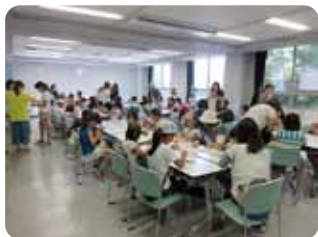
ビーズストラップコーナー