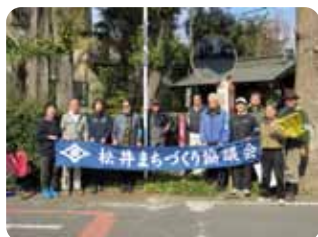
文化歴史遺産 原の地蔵尊