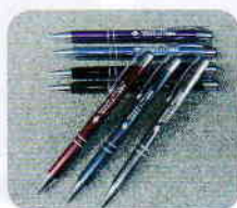
啓発事業ボールペン