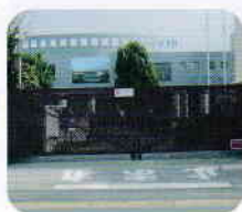
センター門扉塗装