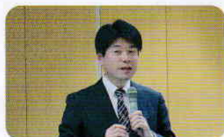
庄嶋代表のテーマ説明