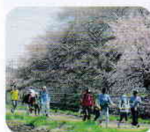
ウォークラリー大会